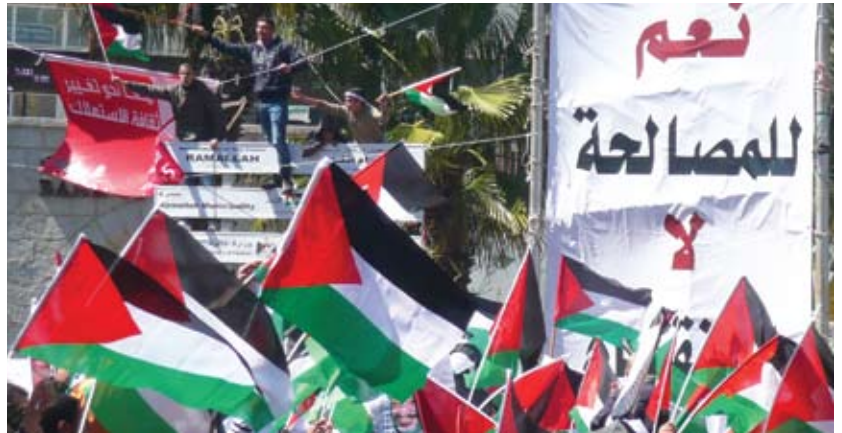
” نعم للمصالحة “

وقد جاء تأسيس حركة حماس عشية الانتفاضة الأولى في عام ١٩٨٧، ليمثل بداية النهاية لهيمنة منظمة التحرير الفلسطينية على السياسة الفلسطينية. وأصبحت حماس (كحركة دينية-قومية ناشئة في داخل فلسطين) في وضع يمكنها من تحدي سلطة قيادة منظمة التحرير الفلسطينية الموجودة في المنفى آنذاك. وقد تمكنت حماس من خلال معارضتها الشديدة لمسار مفاوضات التسوية الذي بدأته وقادته حركة فتح، في تقديم نفسها على أنها حركة المعارضة الفعلية في الحياة السياسية الفلسطينية. كما أن التنافس بين حركتي حماس وفتح قد ترك بصماته على السياسة الفلسطينية الداخلية بشكل واضح منذ التوقيع على اتفاقات أوسلو في عام ١٩٩٣، وعودة قيادة منظمة التحرير الفلسطينية إلى الأراضي الفلسطينية المحتلة وإنشاء السلطة الوطنية الفلسطينية في عام ١٩٩٤ (جمال ٢٠٠٥، ص ٧٣). وبلغ هذا التنافس ذروته في عام ٢٠٠٦، عندما تفاجأ الجميع – بما في ذلك حماس ذاتها – بفوز حركة حماس في انتخابات المجلس التشريعي الفلسطيني، برلمان السلطة الوطنية الفلسطينية، (الشقافي ٢٠٠٦).